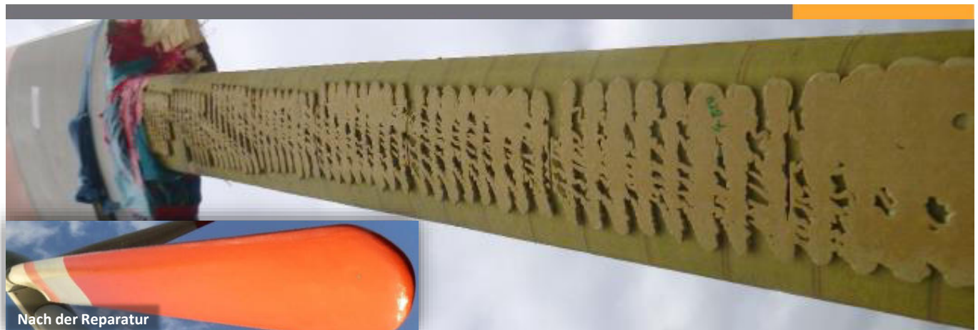
Nach der Reparatur

Die gute Nachricht zuerst: Fast alle Schäden an Rotorblättern können direkt im installierten Zustand repariert werden. Dies spart die außerordentlich hohen Kosten für einen entsprechenden Kran, die Demontage eines Blattes und ein eventuell nötiges neues Blatt.