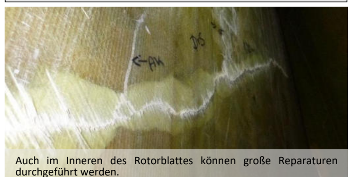
Auch im Inneren des Rotorblattes können große Reparaturen durchgeführt werden.