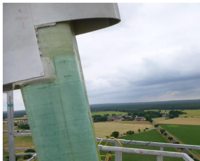
Nach einem Blitzschaden wurde auf einer Länge von 10 m die komplette Blattschale und das Blitzschutzsystem erneuert.

Einige dieser Reparaturen können mit besonders wenig Aufwand per Seilzugang durchgeführt werden. Ist dies nicht möglich, kommen Arbeitsbühnen zum Einsatz.