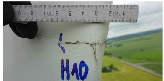
Grieta longitudinal en la pala