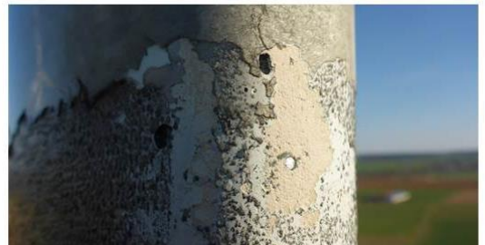
Erosión en el borde de ataque