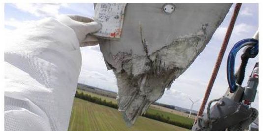
Daño por relámpago en la punta de pala